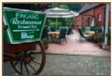
7.) Nartumer Hof Hoppen