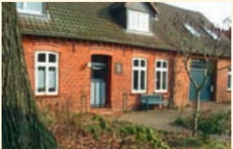
11.) Ferienhof Hesse