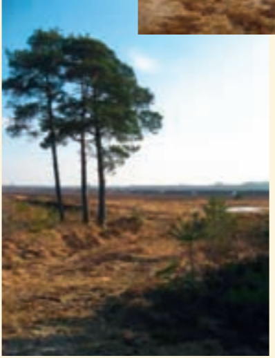
21.) Abenteuerspielplatz Wehldorf