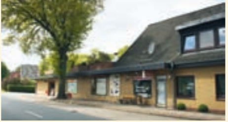
8.) Lebensmittelmarkt Carstens